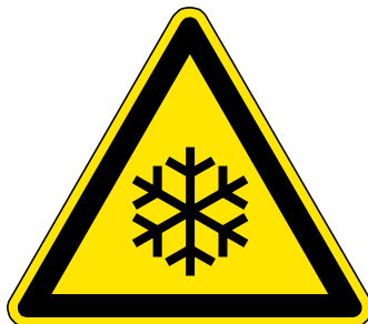
Warnung vor Kälte

CO 2 -Flaschen ohne Steigrohr müssen zur Gasentnahme mit einem Druckminderer betrieben werden, um den Druck auf das für den Anwendungszweck zulässige Maß zu reduzieren. CO 2 -Flaschen ohne Steigrohr müssen zur Gasentnahme aufrecht stehend betrieben werden. Aus einer liegenden Flasche würde flüssiges CO 2 ausströmen, was zum Verstopfen der Entnahmevorrichtung mit CO 2 -Schnee führen könnte. Die Entnahmegeschwindigkeit aus CO 2 -Flaschen ohne Steigrohr ist begrenzt, weil das CO 2 aus der Flüssigphase verdampfen muß.